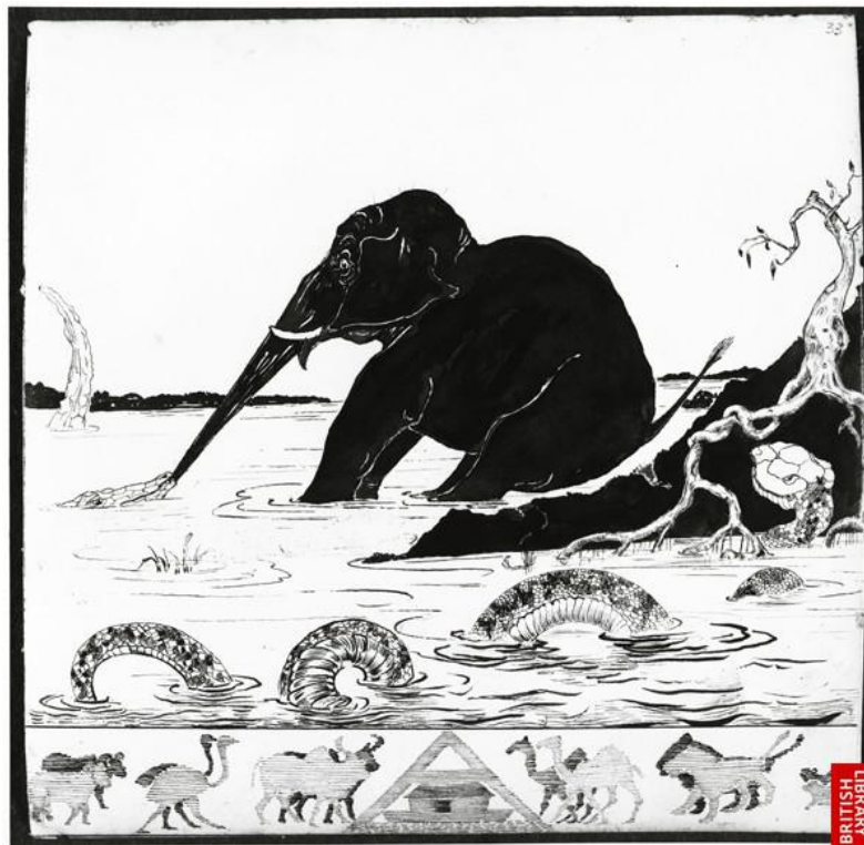
Illustration original de kipling